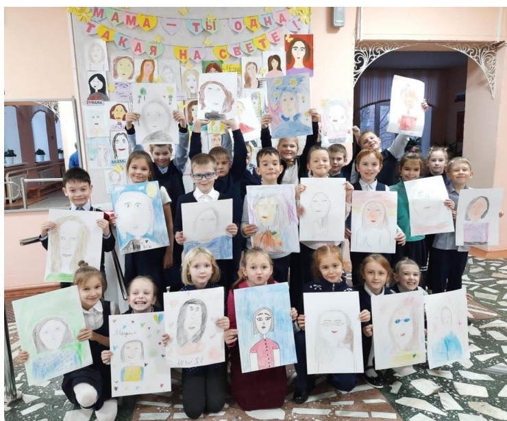
На фото: 2А класс с портретами своих мам