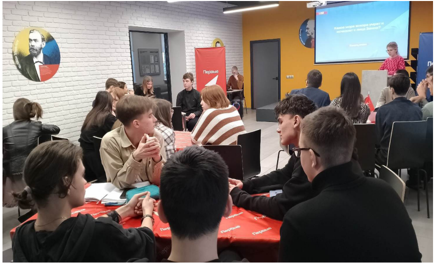
На фото: эпизод игры