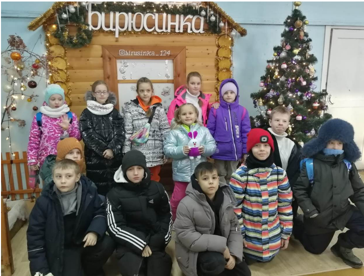
На фото: 3Б класс на фабрике игрушек

Декабрь – особый месяц, наполненный ожиданием новогодних чудес. Создать новогоднее настроение, узнать, как изготавливаются игрушки на праздничную ёлочку отправились в Красноярск на фабрику игрушек «Бирюсинка» ребята 1А, 2А, 3Б классов со своими классными руководителями. Школьники увидели, как мастерицы выдувают стеклянные шары, а художники их расписывают. Узнали, как выпекаются в специальной печи игрушки из пластиголя (ПВХ) и как они тоже попадают в руки художниц. А какие забавные мягкие игрушки и новогодние костюмы шьют швеи! Экскурсия была очень интересной! Восторженные ребята вернулись домой с подарками. Каждый получил в подарок именную шарик на елочку. Путешествие стало для ребят увлекательным и запоминающимся.