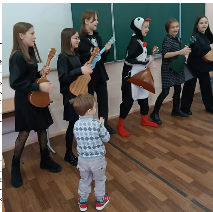
На фото: концерт в 6Б классе, посвященный Дню Матери