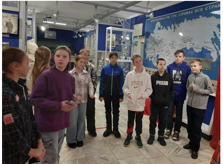
На фото: 5А класс в Городском музее