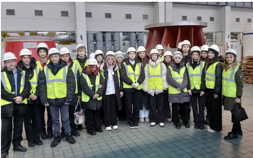
На фото: 9А класс в машинном зале Красноярской ГЭС