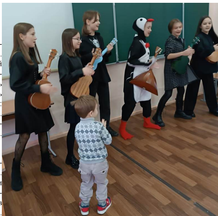
На фото: концерт в 6Б классе, посвященный Дню Матери