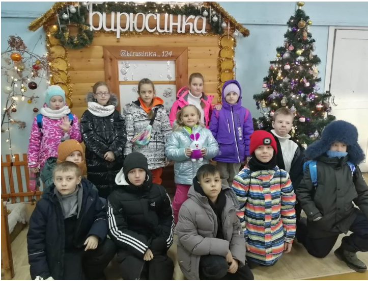
На фото: 3Б класс на фабрике игрушек

Декабрь – особый месяц, наполненный ожиданием новогодних чудес. Создать новогоднее настроение, узнать, как изготавливаются игрушки на праздничную ёлочку отправились в Красноярск на фабрику игрушек «Бирюсинка» ребята 1А, 2А, 3Б классов со своими классными руководителями. Школьники увидели, как мастерицы выдувают стеклянные шары, а художники их расписывают. Узнали, как выпекаются в специальной печи игрушки из пластиголя (ПВХ) и как они тоже попадают в руки художниц. А какие забавные мягкие игрушки и новогодние костюмы шьют швеи! Экскурсия была очень интересной! Восторженные ребята вернулись домой с подарками. Каждый получил в подарок именной шарик на елочку. Путешествие стало для ребят увлекательным и запоминающимся.